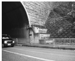
下畑トンネルの歩道に防護策をつけていただきました。