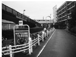
無料化されたたくさんの市民に使用されている名谷南無料駐輪場