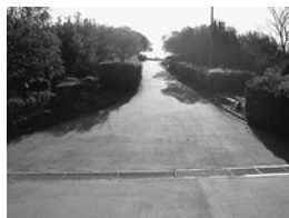
きれいに舗装され、おらが山の山道が生まれ変わりました。