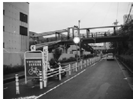
以前の有料駐輪場