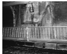
防護策がついて、歩行者の安全も確保できました。