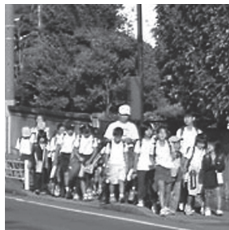
地域での見守り体制強化が課題に