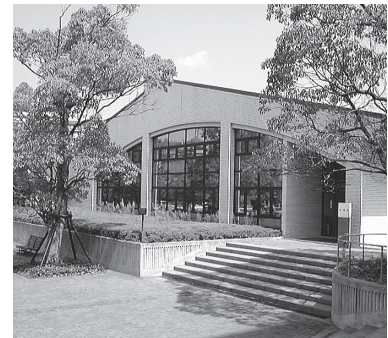
独立行政法人化の準備が進む神戸市外大