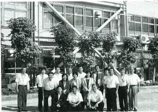
学校耐震化工事等の現地視察も行いました。(9月16日)

19年度決算認定に当たっての 主な要望事項 ○神戸空港は、3空港一体運用も視野に運用時間や発着枠の拡大に努められたい。 ○水上警察署、合同庁舎の移転などウォーターフロント整備に早急にとりかかられたい。また、環境に優しい街の移動にEST導入等の構想を進められたい。 ○医療センター中央及び西市民病院は、来年4月の地方独立行政法人化後も、運営の根幹である患者サービス等の一層の充実に努められたい。